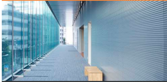
Howai E 1 大きなガラス面はエビスパルビルのデザインの象徴。自然光が注ぎ、催事の休憩時などでリラックスできる開放的なスペースとなっています。

自然光溢れる開放的なHowai E、 暖かみあるフローリングが印象的なイベントホール。 自由な空間デザインを可能にするスライディングウォールや 充実した演出設備が、お客様の求める様々な用途にお応えします。 恵比寿駅から徒歩3分。